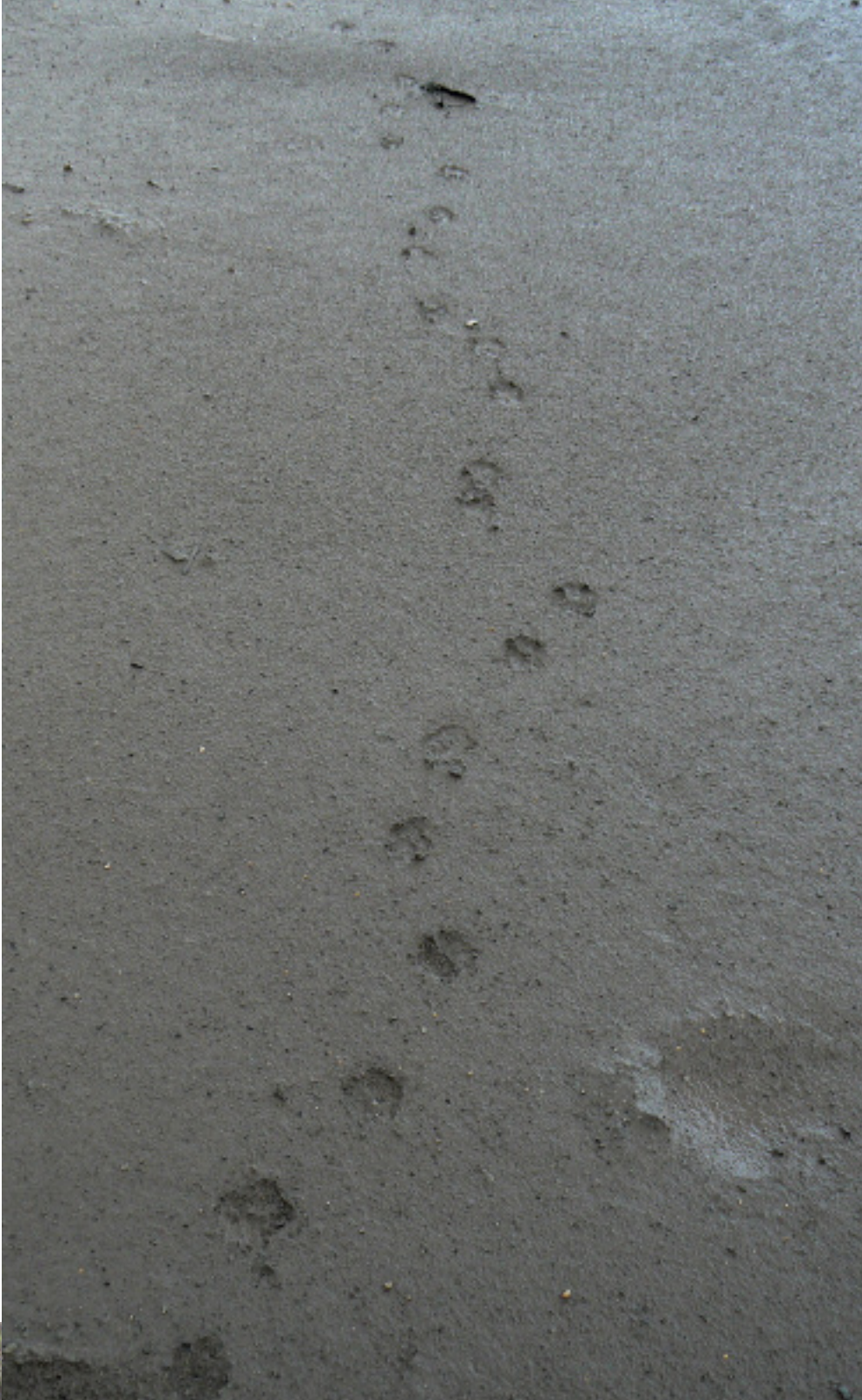
Foto 5. Aanvullend kenmerk voor het loopspoor van een wasbeerhond is de vaak wat slingerende loopwijze.

beerhond een H. In ideale gevallen heeft de omtrek van een vossenprent een druppelvorm, een hond een klaverbladvorm en een wasbeerhond een cirkel (figuur 1).