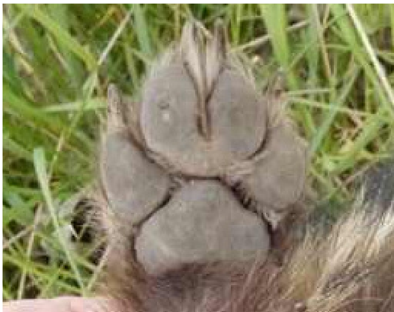
Foto 6. Voorvoet van een wasbeerhond.