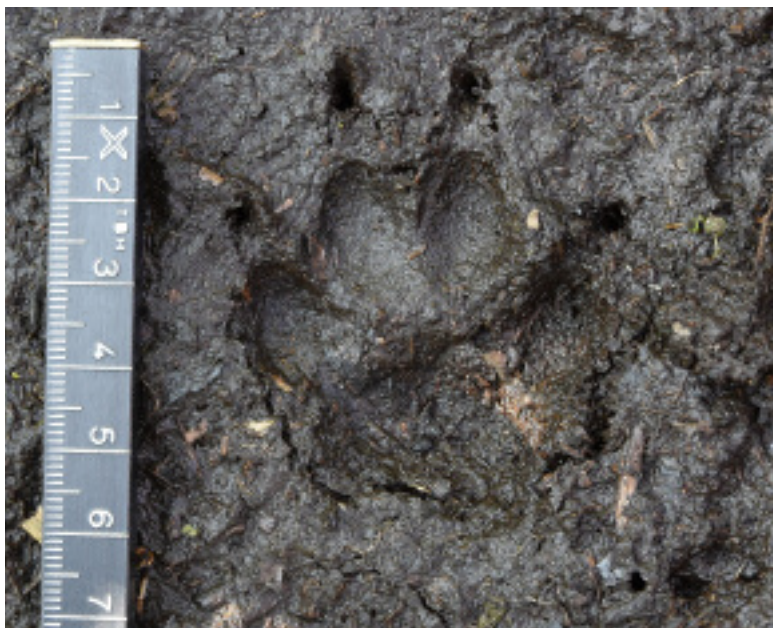
Foto 7. Prent van de voorvoet van een wasbeerhond in sporenbed. De Onlanden, Drenthe, 2016.