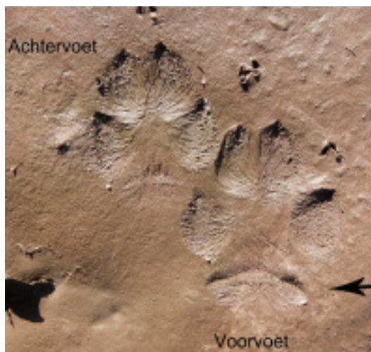
Foto 3. Prent van een voorvoet en achtervoet van een vos. De indruk van het balkje is hier vooral bij de voorvoet (pijl) goed te zien; bij de achtervoet moet je goed kijken om het te zien. Havelte, 2016.