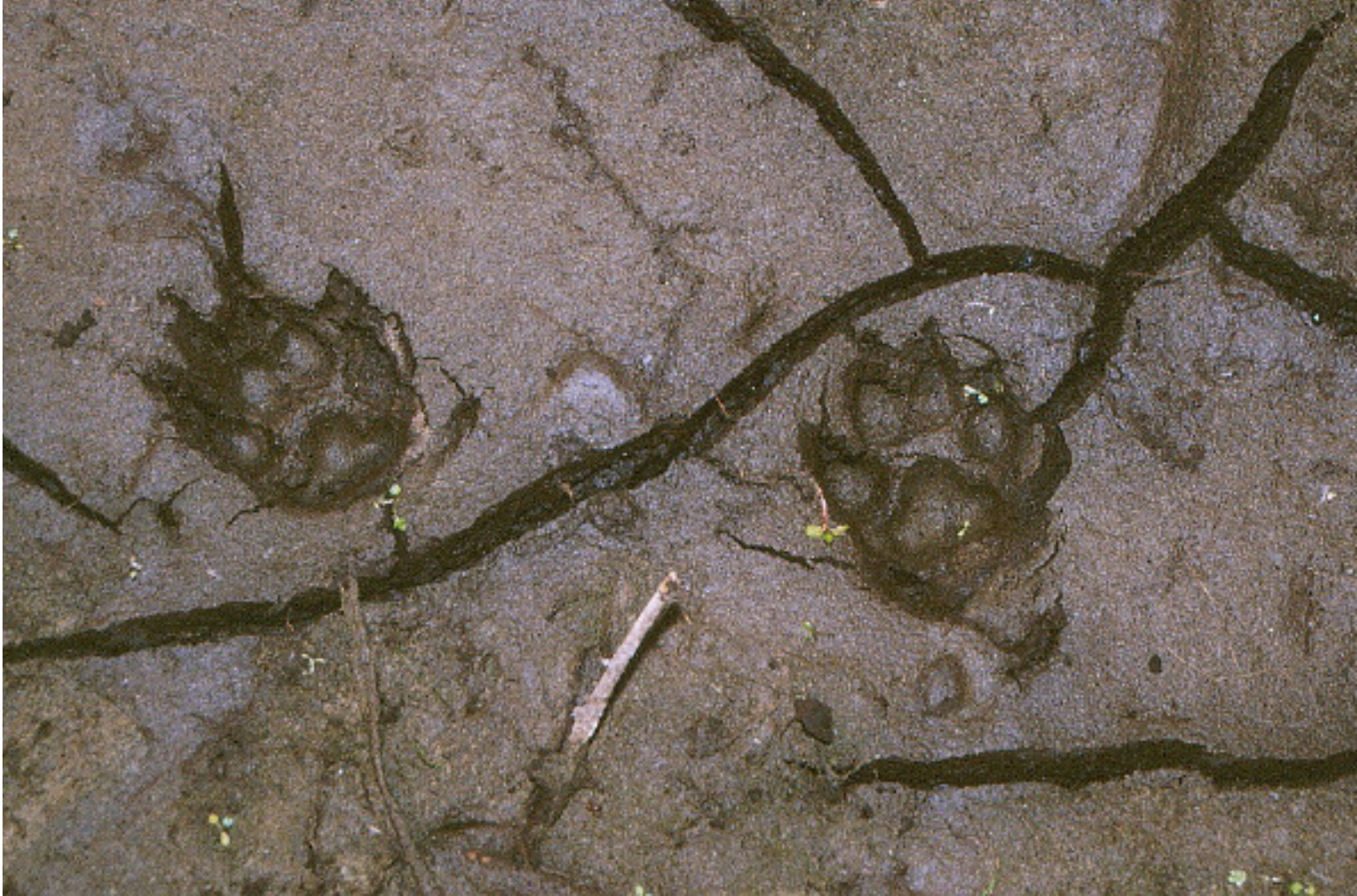
Foto 1. Prenten van wasbeerhond. Het 3-lobbige 'wolkje' in het middenvoetkussen is hier goed te zien.