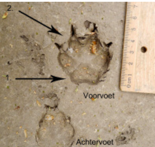
Foto 2. Prenten van een wasbeerhond. Hier zijn de lobben in het middenvoetkussen al minder goed te zien. Wit-Rusland, 2016.