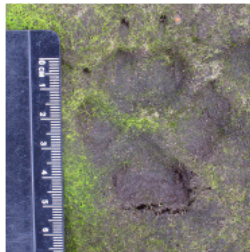
Foto 4. Prent van een kleine hond. De bovenste tenen staan parallel en de vorm van het middenvoetkussen is iets meer driehoekig of hartvormig in plaats van 3-lobbig. Voor de vergelijking hond-wasbeerhond is het niet als uitsluitend kenmerk te gebruiken. Friesland, 2014.